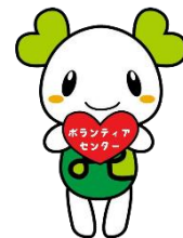
苫社協 マスコットキャラクター ハートマちゃん