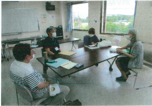
△ 参加者交流を兼ねたグループワーク

務と後見人の倫理性ほか、酷暑の時期と相まってお盆を挟んで過酷な試練は続きます。 研修生各位には熱中症や新型コロナウイルス対策等の体調管理に十分に留意され、晴れの修了式当日には誰一人欠けることのないよう衷心よりご祈念申し上げます。