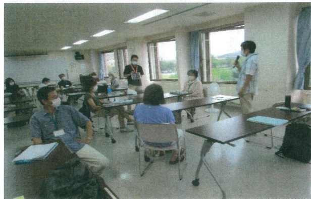
△ グループワークの結果報告

養成研修修了後はその後もフォローアップ研修が毎年2回程開催されます。先輩市民後見人の事例報告や、専門職後見人の対人技術などの講義の後、少人数で意見交換します。この時期、同期生との再会が図られることから、楽しいコミュニケーションの場ともなっています。