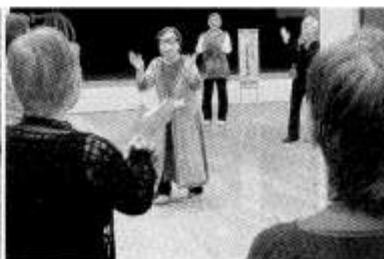
ラフターヨガでみんな笑顔に♪