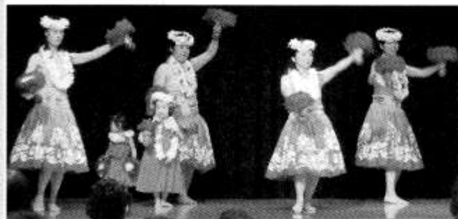
親子で楽しくフラダンス