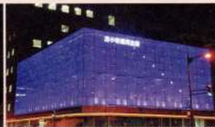
苫小牧信用金庫本店ビル

活動に参加して頂きました。また、苫小牧市男女平等参画課では、建物を紫色で照らす「パープルライトアップin苫小