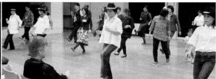
みんなでワイワイ!! カントリーダンス♪