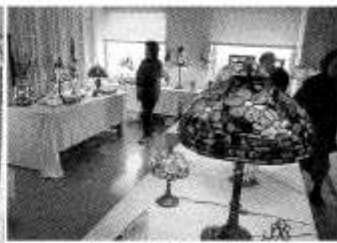
ステンドグラス作品