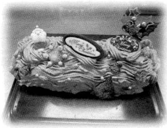
ブッシュドノエルのチョコ味