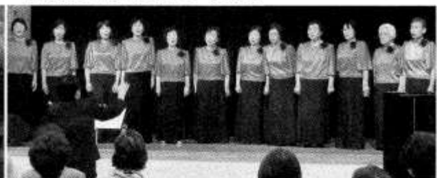
美しい歌声のコーラスサークル