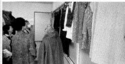
手作りの洋服に見とれています