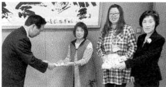
社会福祉協議会へ寄付

43団体/約600人のサークル会員が、日々の学習を通して仲間とのふれあいを大切にするとともに、福祉の増進にもお手伝いすることを目的として活動しています。会員の作品展示・ステージ発表で1年間の活動の成果を発表したほか、会員手作りの作品や喫茶・茶席のチャリティバザーを行い、その益金を市と社会福祉協議会に合計168,600円寄付し、福祉に役立たせて頂くことが出来ました。ご協力ありがとうございました。