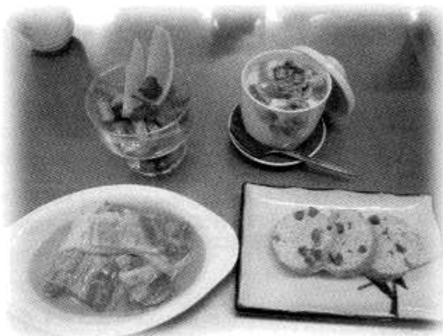
左上：キャンディポテト 右上：洋風茶碗蒸し 右下：鶏かまぼこ 左下：白菜の重ね蒸し